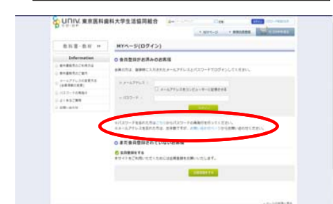
登録パスワードを忘れてしまった方はこちらの画面からパスワードの再発行が即日行えます。