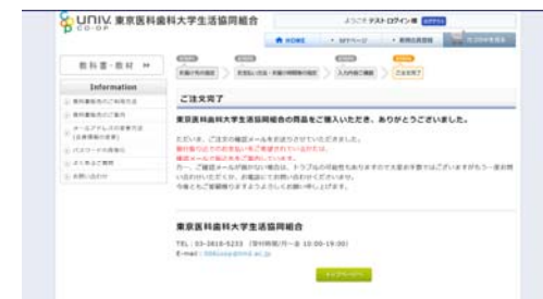
ご注文が完了画面が表示されると、ご登録アドレスに注文完了メールが配信されます。(*コンビニ支払を選択された方は別画面が表示されます)