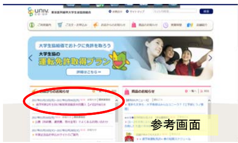
東京医科歯科大学生活協同組合HPお知らせトップのお知らせをクリック