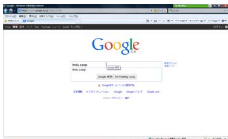
URL http://www.univcoop.jp/tmd/ 又は検索サイトでtmd coopと入力