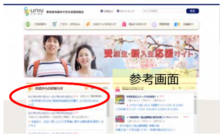
東京医科歯科大学生活協同HPお知らせトップのお知らせをクリック